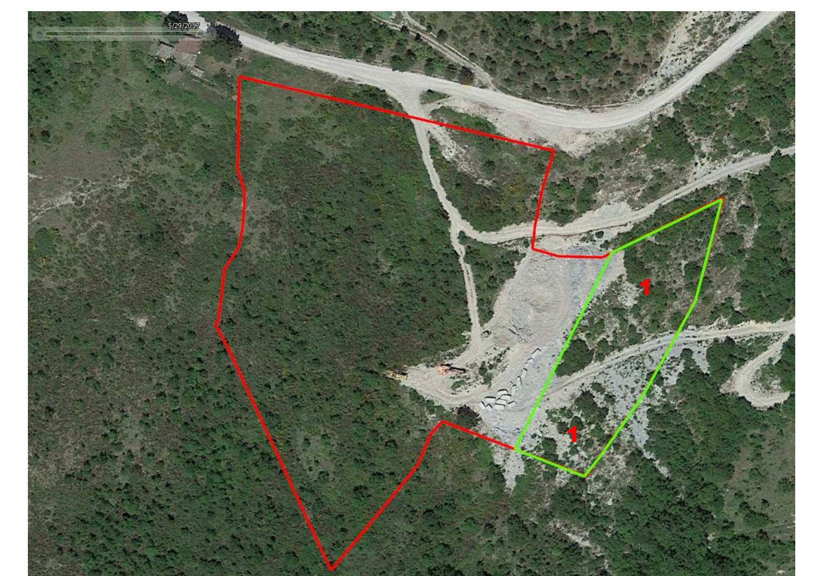
Foto 3 - foto Google del maggio 2017 con sovrapposizione del limite della UMI 1 oggetto della presente richiesta di autorizzazione (in rosso) e dell'areale che nella prossima autorizzazione non sarà interessato da nessuna opera e/o movimentazione terra (in verde). Il numero 1 indica le porzioni sulle quali sono ad oggi presenti morfologia e vegetazione preesistente alla autorizzazione n.29/2011 (areali sui quali non si è mai intervenuti nel tempo).