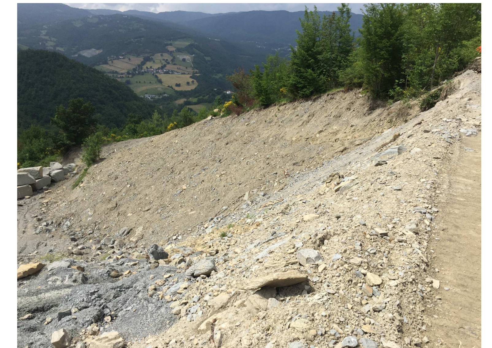
Foto 2 - panoramica dell'ambito n.4 nella figura a lato. Sulla sinistra nella foto il margine della pista podereale ripristinata nell'originale sedime. Sulla destra nella foto l'areale da quale si procederà all'estrazione del materiale utile nella prossima autorizzazione (margine segnato dalla presenza di alcuni blocchi di mt. utile da rimuovere). Tutto il fronte nella foto non sarà ulteriormente scavato nella prossima autorizzazione e si procederà altresì alla sua completa e definitiva sistemazione.