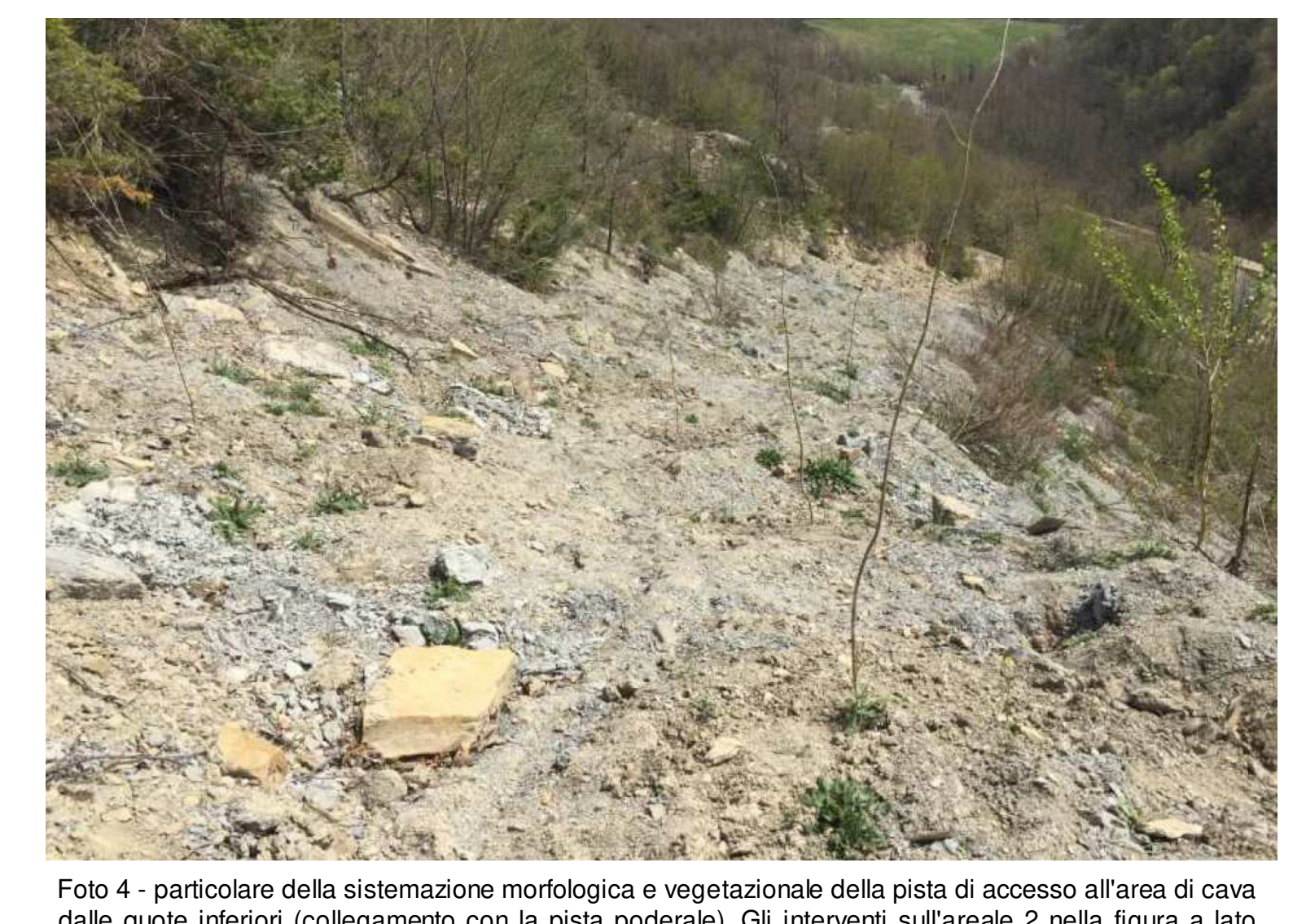
Foto 4 - particolare della sistemazione morfologica e vegetazionale della pista di accesso all'area di cava dalle quote inferiori (collegamento con la pista podereale). Gli interventi sull'areale 2 nella figura a lato sono stati ultimati con impianto vegetazionale (visibile anche in foto).