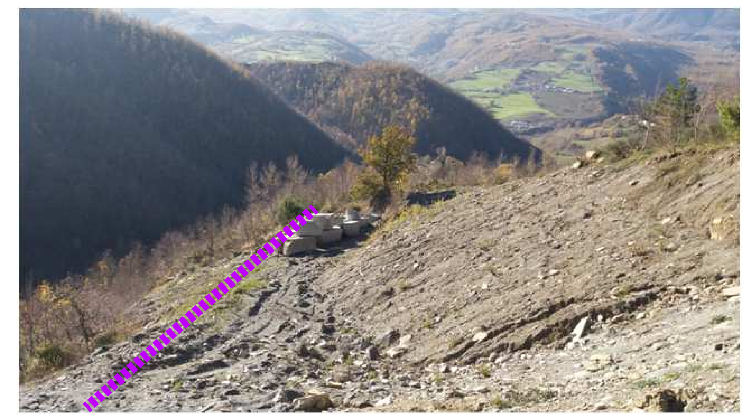
Foto 5 - panoramica del settore estrattivo nella passata e ultima fase autorizzativa. La linea viola in foto individua il confine tra gli areali 3 e 4 nella figura a lato; sulla destra nella foto l'areale 4 nel quale si sono svolte nella precedente autorizzazione le attività di cava per estrazione del materiale utile; sulla sinistra della linea viola nella foto il punto di arrivo della pista di collegamento con la podereale e la zona utilizzata come deposito di rifiuti estrattivi. Gli areali sulla sinistra nella foto sono stati già oggetto di ripristino morfologico e verranno completati, con la prossima autorizzazione, gli interventi di sistemazione vegetazionale.