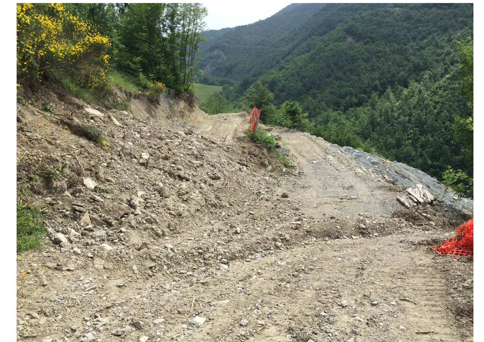
Foto 1 - ripristino del sedime della pista podereale e sistemazione della scarpata sul fronte cava